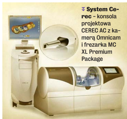
System Cerec - konsola projektowa CEREC AC z kamerą Omnicam i frezarka MC XL Premium Package

wytwarzającego zaprojektowane odbudowy protetyczne z bloczku porcelanowego. Odbudowy protetyczne frezowane są za pomocą wiertel diamentowych z dokładnością do 20 mikrometrów. Czas potrzebny do wykonania idealnej odbudowy protetycznej to mniej więcej dwie godziny.